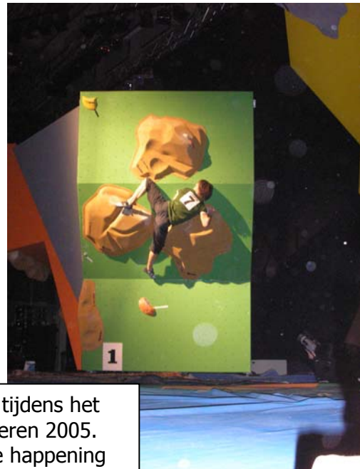
De finale tijdens het NK boulderen 2005. Een grote happening in een evenementenhal, met eigentijdse muziek, honderden bezoekers en sfeervolle belichting (rechts).

Spelregels bij boulderen zijn: dat je zowel de begingreep als de eindgreep met twee handen moet vasthouden, gedurende 2 seconden, terwijl je in balans staat in de wand. Tussen begin en einde mag je de grond niet aanraken en mag je ook geen andere grepen of treden gebruiken dan bedoeld in deze boulder.