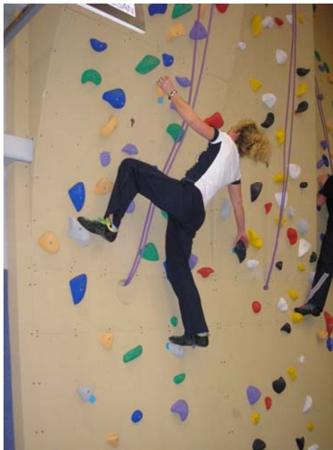
Boulderen tijdens de studiedag; de boulder is uitgezet met plastic kaartjes onder de grepen en treden (links boven).

Boulderen is het klimmen van een korte, meestal moeilijke en ingewikkelde route, die boven matten wordt gedaan, zonder te beveiligen door middel van touw en gordel. Het is sinds een jaar of 10 een aparte tak van het sportklimmen en er zijn steeds meer klimmers die alleen nog maar boulderen. Voorafgaand aan de studiedag had ik 4 boulders voorbereid die ik de deelnemers liet klimmen. Het is altijd spannend of er in ieder geval minimaal bij een paar deelnemers de boulders lukken. Bij het bouwen heb ik bewust technieken ingebouwd die vooraf behandeld zijn. Boulderen leent zich uitstekend voor zelfervarend leren. Boulderen wordt pas boeiend als je de basis van klimmen begint te beheersen en dit kan al vrij snel nadat de klimmer zich veilig voelt. Door veel te boulderen word je niet alleen beresterk, maar doe je ook veel bewegingservaring op.