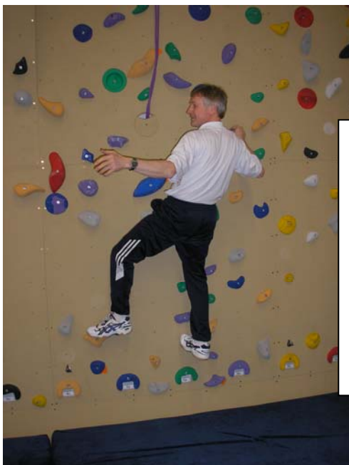
De 'open deur' situatie (links)

Hierna zoeken de groepjes hun eigen open deur en bedenken daar mogelijke oplossingen voor: veranderingen van houding (positioneren), waardoor de open deur wordt voorkomen.